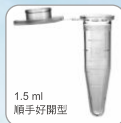
1.5 ml 順手好開型