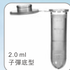
2.0 ml 子彈底型