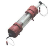
大體積空管 (XK columns)