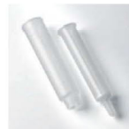
13ml 空管 (# 17043501)